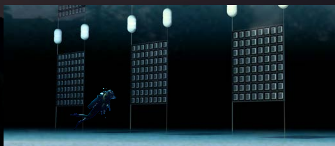
MPC COAST WALL - 水中集電