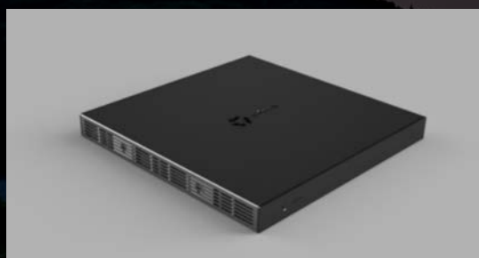
MPC SMART CHARGER

シンポジウム会場内では、新たな電力資源として社会支援をめざす超小集電の最新技術や先端的研究の成果をご覧ください。展示は研究開発の歴史から始まり、暮らしの中でのMPC活用の提案、様々な産業技術とのマッチングを期待させる技術局面での先端的挑戦から具体的な技術提案に至るまでをご紹介します。