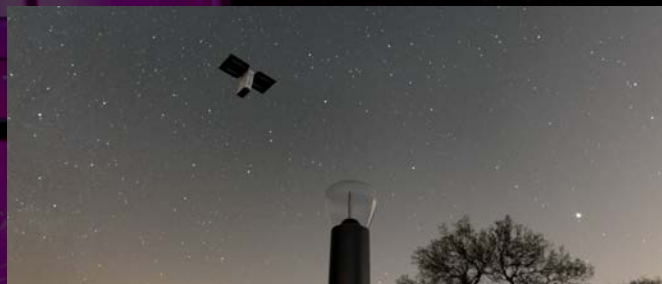
MPC STANDALONE NODE