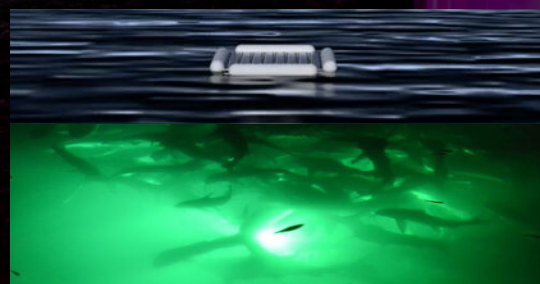
MPC PONTOON - フロート型集電